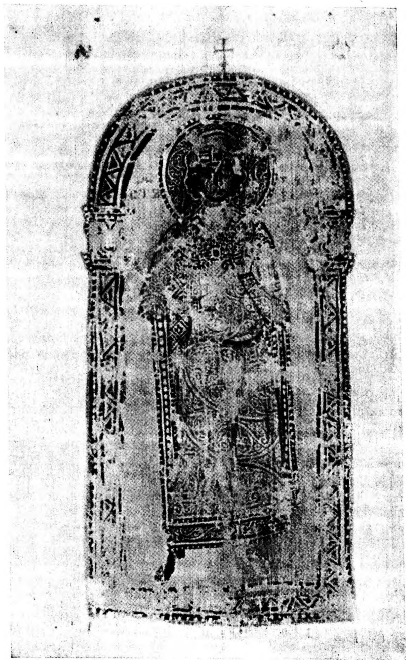
Князь Борис—Михаил Болгарский. Рукопись, Сип. собр., № 262