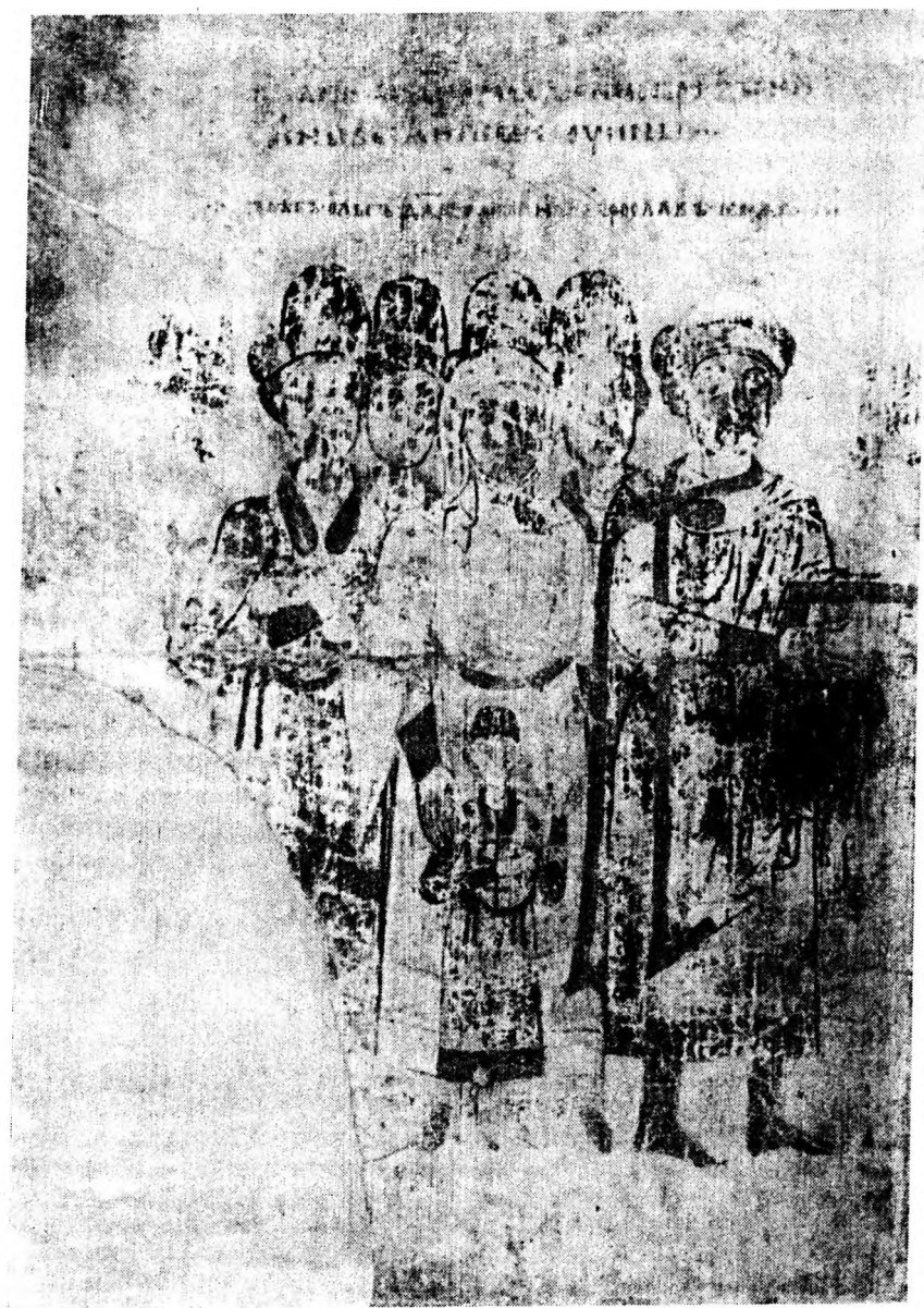
Миниатюра с изображением великого князя Святослава и его семьи