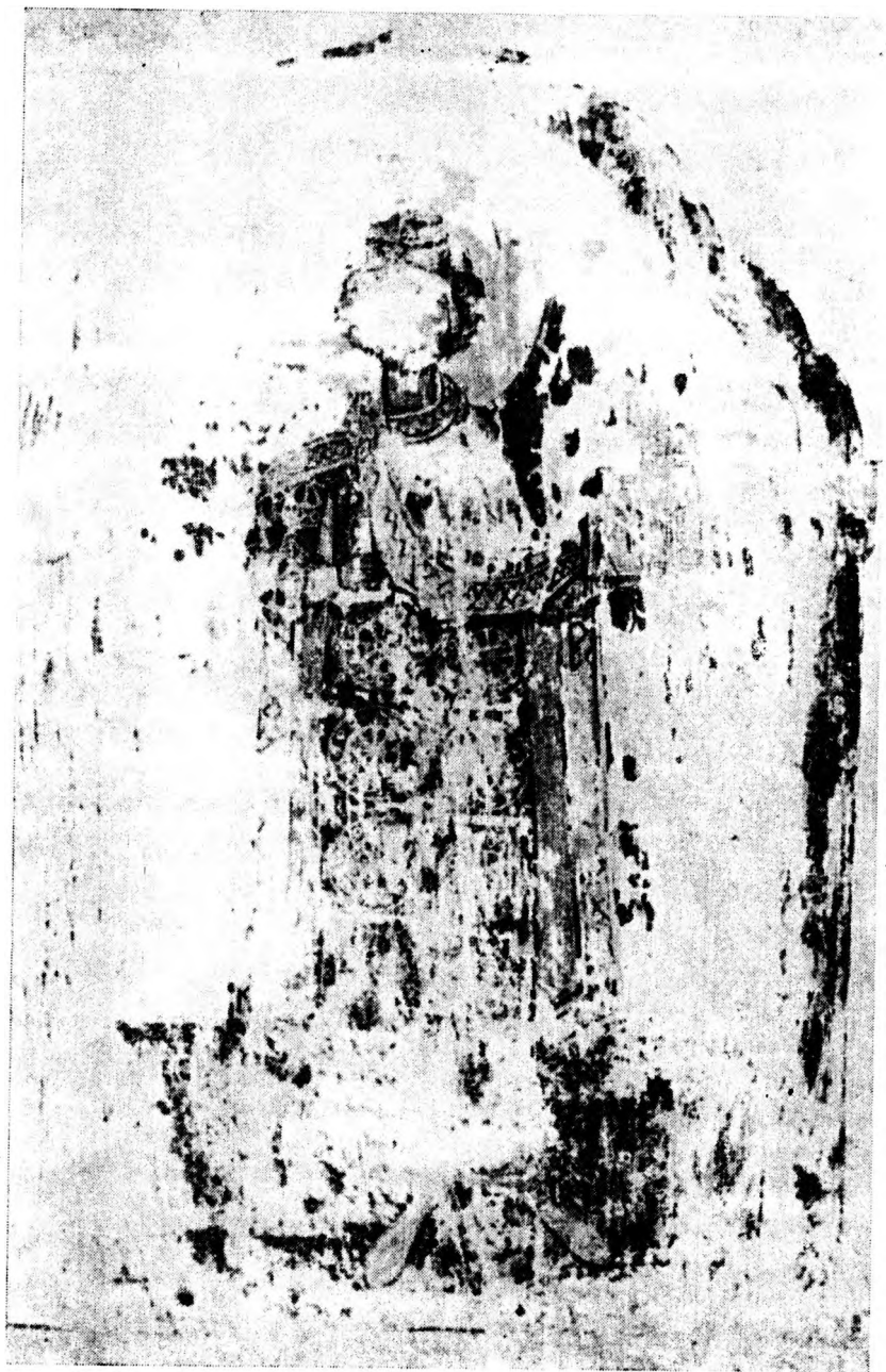
Князь Борис—Михаил Болгарский. Рукопись Чудовского соб р. 12